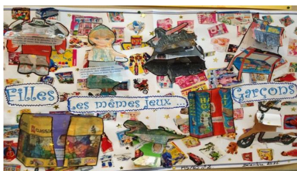
« filles/garçons, les mêmes droits », école maternelle La Tour d'Auvergne - REP Moulin-Joly

Sur les murs des deux collèges, têtes de réseau, Monsieur Terrien découvrait les « Fresques de la laïcité ».