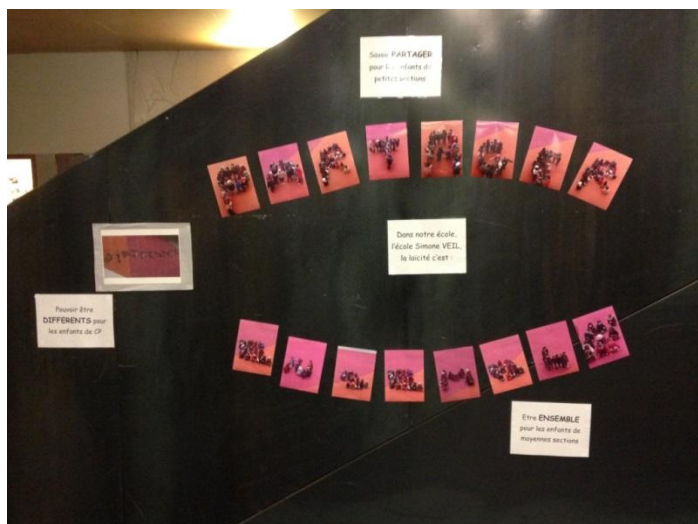
« Partager », « Ensemble », photographies de figures corporelles des élèves du groupe scolaire S. Veil - REP M. Duras

« Outre la transmission des connaissances, la Nation fixe comme mission première à l'école de faire partager aux élèves les valeurs de la République. Le service public de l'éducation nationale fait acquérir à tous les élèves le respect de l'égalité des êtres humains, de la liberté de conscience et de la laïcité ». En résonance avec cet article du Code de l'Éducation, quelle institution autre que l'école est à même d'apprendre à l'élève, par l'exercice de la citoyenneté, à aiguiser son jugement critique pour former un citoyen éclairé, préservé de toute forme d'obscurantisme et d'extrémisme ?