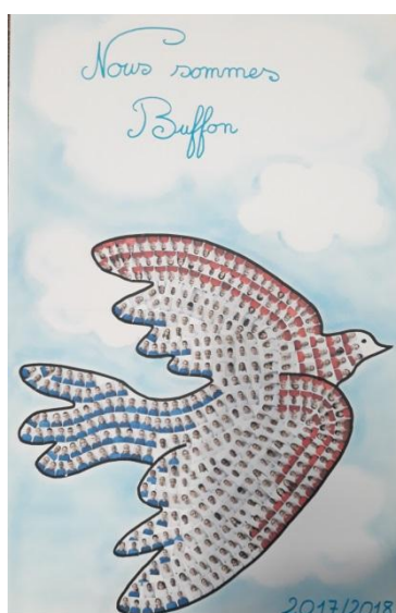
« Colombe », symbole de la paix, de la République, et de la diversité - école élémentaire Buffon - REP M. Duras