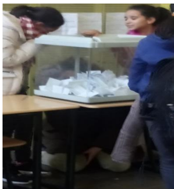
Election des représentants d'élèves au CVC – collège M. Duras